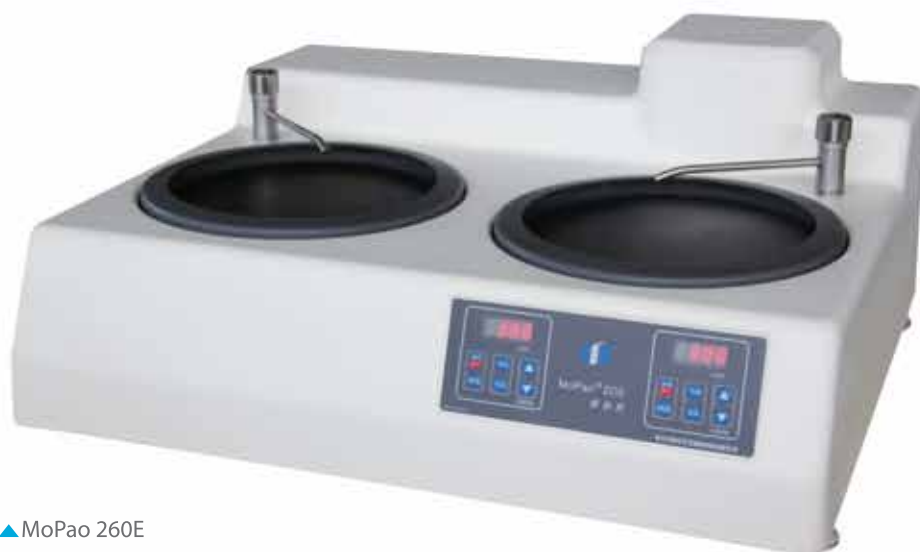
▲ MoPaо 260E