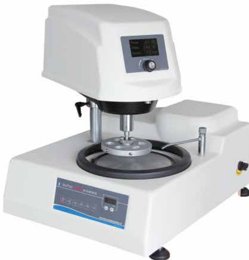
▲ МоРао 1000В

Автоматический шлифовально-полировальный станок МоРао 1000В, предназначенный для грубого шлифования, шлифования, грубой и тонкой полировки образцов для металлографии в автоматическом режиме, является идеальным выбором оборудования для подготовки образцов для предприятий, научно-исследовательских организаций и университетов.