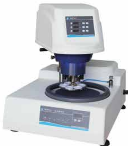
▲ МоРао 3