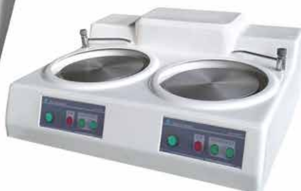
▲ MoPao 2D с двумя моторами и независимым управлением