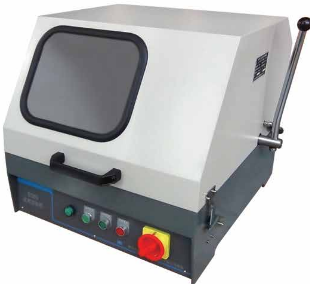
▲ SQ 80/100

Отрезной станок удобен в эксплуатации, безопасен и надежен. Он относится к оборудованию для подготовки шлифов, которое необходимо иметь для проведения металлографических испытаний на предприятиях, в научно-исследовательских организациях и лабораториях университетов.