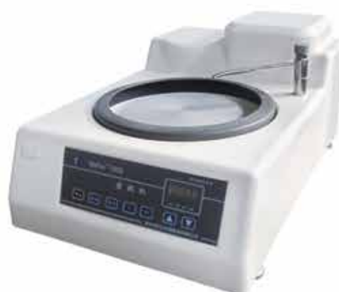
▲ MoPaо 160E