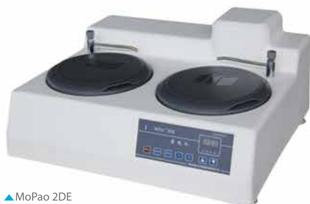
▲ MoPaо 2DE

Станки данной серии имеют один или два диска, шлифовальный/полировальный диск является быстросъемным. Станки оснащены устройством водяного охлаждения, которое предназначено для охлаждения шлифа во время шлифования для предотвращения разрушения микроструктуры из-за перегрева шлифа. Станки просты в эксплуатации, безопасны и надежны. Это идеальное оборудование для предприятий, научно-исследовательских организаций и университетов.