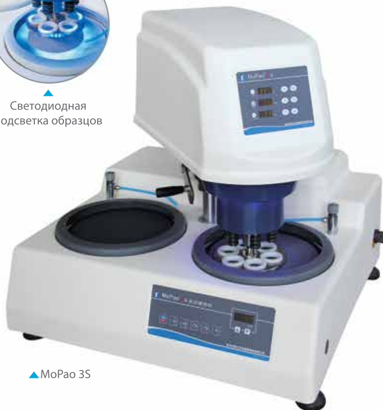
▲ МоРао 3S