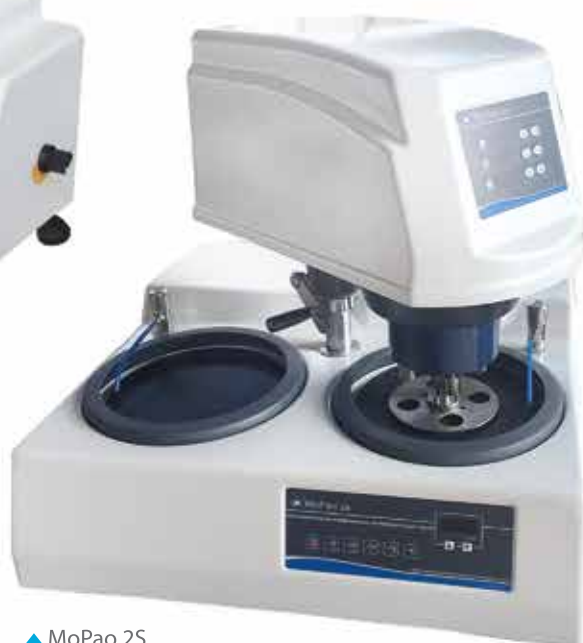
▲ МоРао 2